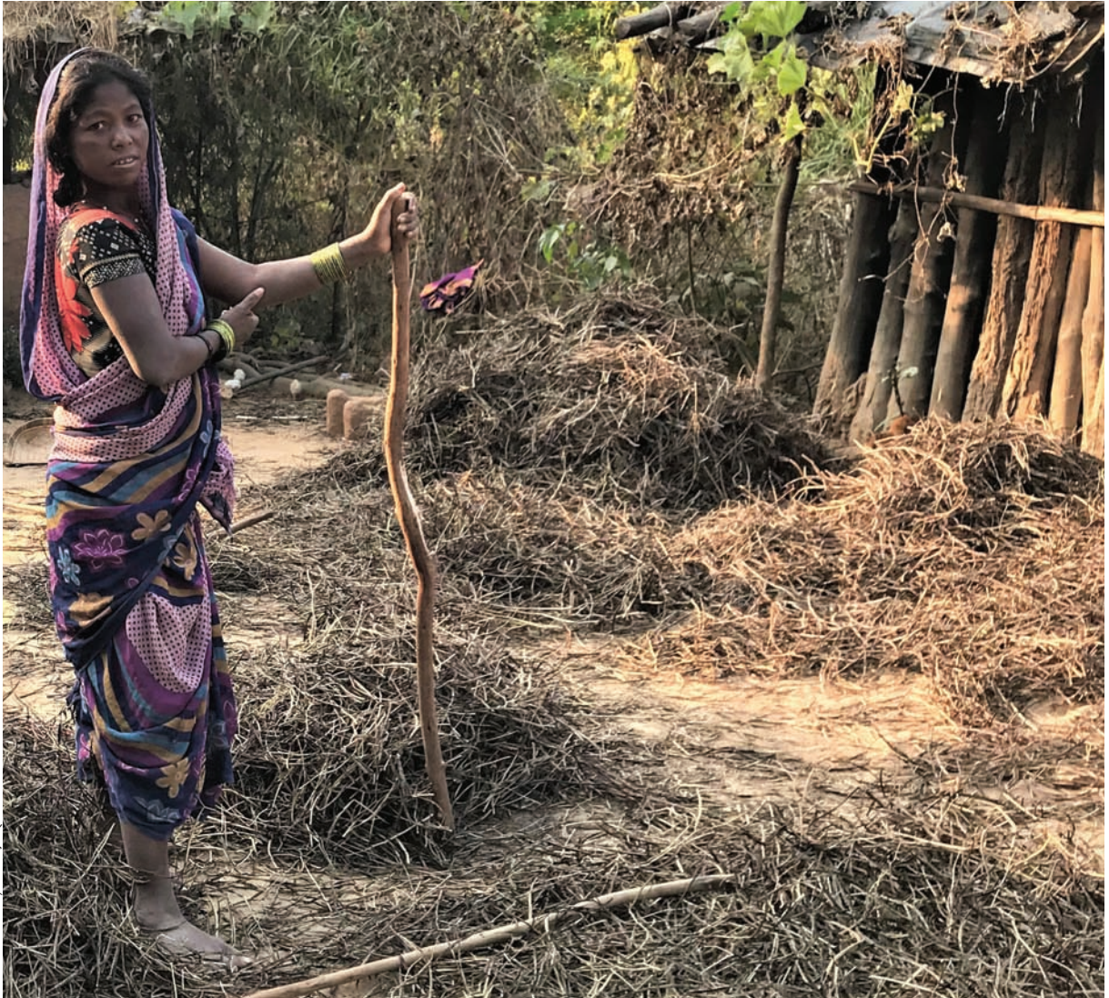
विन्मयी शाल्य / सीएसई

आजीविका में सुधार कोरबा की एक प्रमुख चिंता है, लेकिन फिर भी जिले ने आजीविका के लिए डीएमएफ की पूरी स्वीकृत राशि का केवल 1.3 प्रतिशत हिस्सा दिया गया है