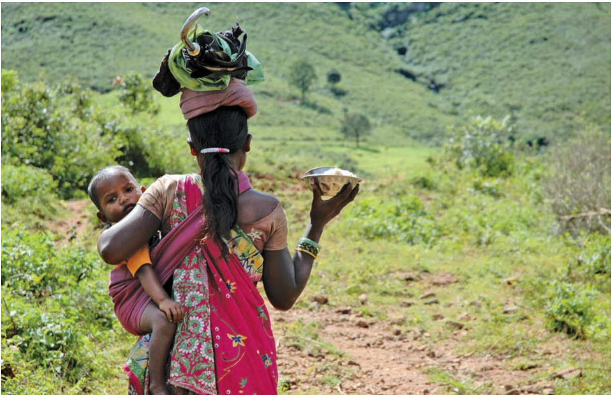
सयातन बेरा / सीएसई

कई खनिज जिलों में बड़ी संख्या में अनुसूचित जनजातीय आबादी निवासरत है। इन जिलों में मानव विकास संकेतक भी बहुत गंभीर हैं