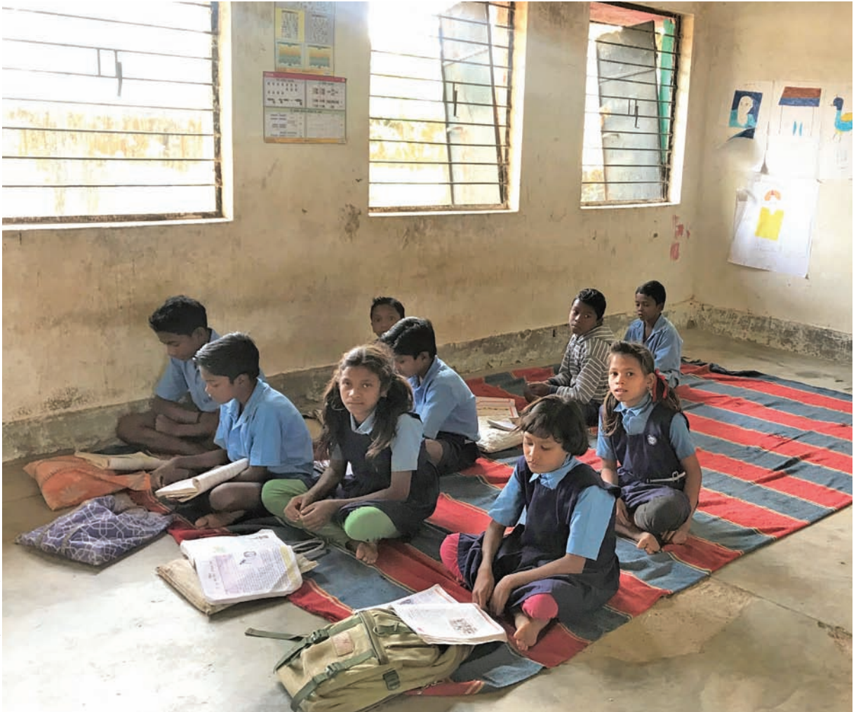
चिन्मयी शल्य / सीएसई

एक दूरस्थ और जनजातीय बहुल जिला, दंतेवाड़ा में सबसे खराब आय के स्तर, व पोषण संकेतक हैं, और स्वच्छ पानी जैसे बुनियादी सुविधाओं की यहां सुलभता नहीं है, जो स्वास्थ्य के लिए अत्यंत महत्वपूर्ण है (देखें तालिका 9: प्रमुख मानव विकास संकेतकों और सुविधाओं की स्थिति)। जिले के खनन प्रभावित क्षेत्रों के साथ इन कारकों को ध्यान में रखते हुए, इसकी प्रभावशीलता के संदर्भ में दंतेवाड़ा में निवेश मिश्रित बैग प्रवृत्ति का सुझाव देता है—