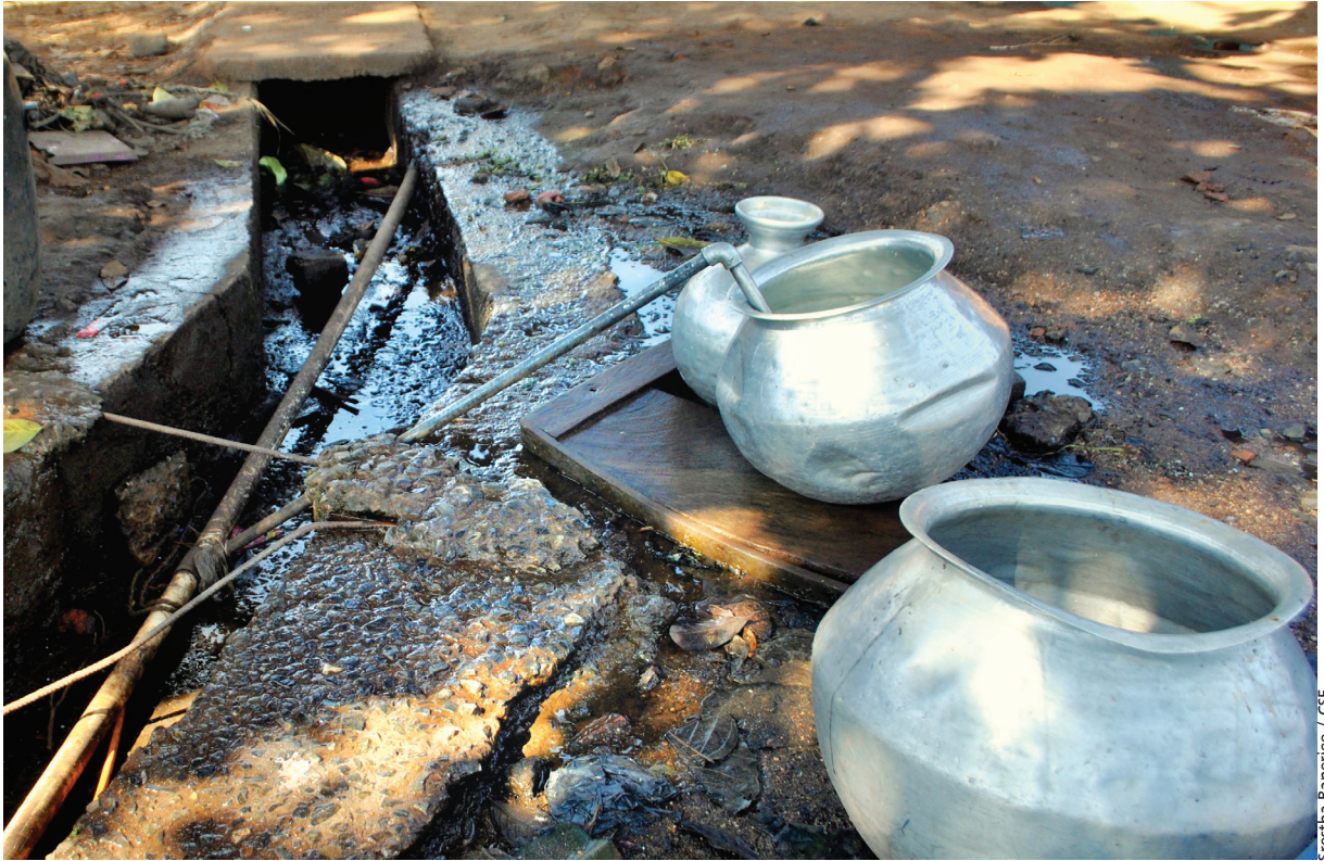
Srestha Banerjee / CSE

ଓଡ଼ିଶାରେ ସମୁଦାୟ ଡିଏମ୍‌ଏଫ୍ ମଞ୍ଚର ରାଶିର ପ୍ରାୟ 25.2 ପ୍ରତିଶତ ଜିଲ୍ଲାମାନଙ୍କରେ ପାନୀୟ ଜଳ ଯୋଗାଣରେ ଉନ୍ନତି ଆଣିବା ପାଇଁ ପ୍ରଦାନ କରାଯାଇଛି